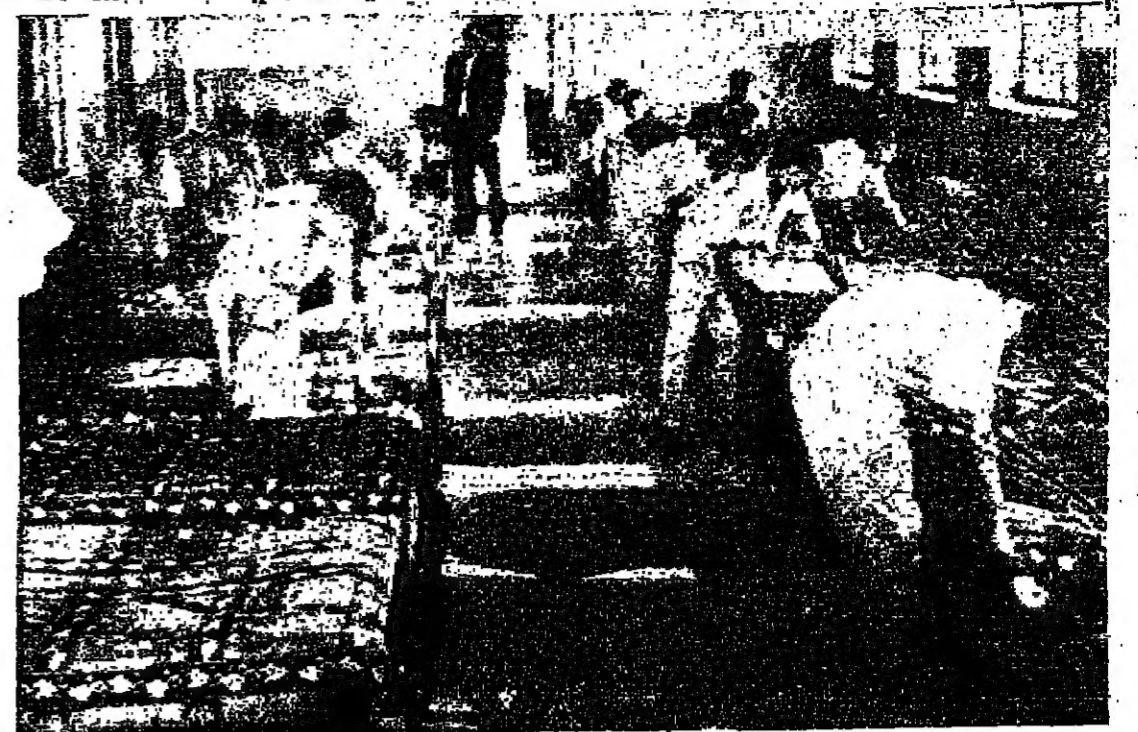
في الدار يتعلمون الاعتدال على انفسهم يتقنون برتقباتهم وتطويع اماكن اقامتهم يتقنهم

اما الحكم فهو الحدث الذي يحول المنا من المحكمة نتيجة حكم معين عليه بقضاء مدة محددة في الدار .. وهذا الحكم توجه له غاية خاصة .. وبعد مرور ثلاثة اشهر عليه تقرر له العمل الذي يريد خارج الدار .. ولعلك تصعب اذا علمت انه يوجد اكثر من ثلاثين حننا يملون في محاجر وشركات في المصانع يذهبون الى عملهم في الصباح ويعودون الى الدار في المساء .. وقد اثبتت هذه التجربة مدى إمكانية اصلاح الحدث من خلال علاج معين ..